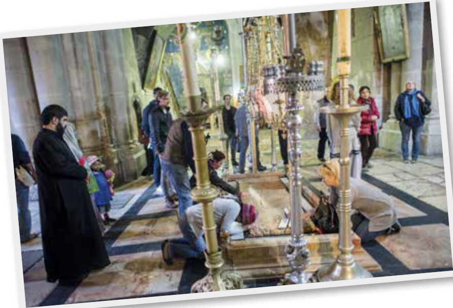
Die Grabeskirche liegt in der Altstadt von Jerusalem. Sie wird von sechs christlichen Konfessionen verwaltet.

Situation wird sowohl von deutschen als auch von anderen internationalen Reiseunternehmen leider vielfach stillschweigend hingenommen. Es fällt bei Reisen ins Heilige Land offensichtlich schwer, die politische und völkerrechtliche Komplexität konkret anzusprechen, obschon sich doch die wichtigsten Pilgerziele auf palästinensischem Gebiet befinden (Grabeskirche, Ölberg, Via Dolorosa, Geburtskirche, Hirtenfelder, Herodium, Jordan-Tal, Jericho oder Abrahams Grab). Von daher wäre es für Veranstalter von Pilgerfahrten dringend geboten, zur entsprechenden Sensibilisierung von Touristinnen und Touristen beizutragen und für ausgewogene Reiseprogramme zu sorgen.