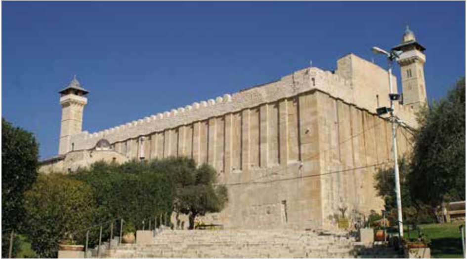
Außenansicht der Abraham-Moschee (al-Haram al-Ibrahimi): Metalltore trennen die Moschee von der Synagoge innerhalb des gemeinsamen, aber strikt getrennt zugänglichen Gebäudekomplexes.

500 israelische Siedler. Statt respektvollem Miteinander bestimmen heute in Hebron Überwachungstürme, Zäune und Straßenblockaden den Alltag.