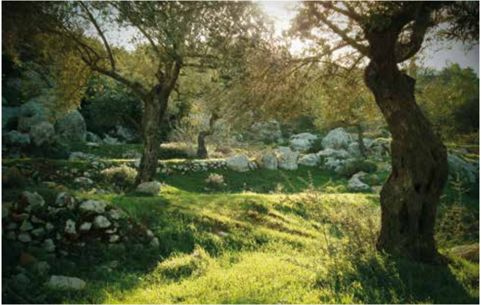
Die Olivenbäume in der Nähe des Klosters Creminsan bei Bait Jala werden von einem christlichen Bauern bewirtschaftet.

verbreitete Annahme, Jerusalem sei die ungeteilte Hauptstadt Israels. Doch dieser Status ist international nicht anerkannt. Aus diesem Grund befinden sich die meisten ausländischen Botschaften, auch die deutsche, in Tel Aviv.