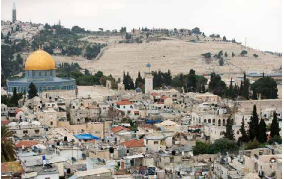
Blick auf den Felsendom und die Altstadt von Jerusalem.

Das Heilige Land ist faszinierend – das spürt fast jeder, der hierher kommt. Die multireligiöse Vielfalt, Begegnungen von Menschen aus aller Welt und die heiligen Stätten ziehen seit Jahrhunderten Reisende an. Doch viele Besucherinnen und Besucher empfinden auch Beklemmung und Unsicherheit, wenn sie beispielsweise Pilgergruppen sehen, die beim Gang durch das Jaffa-Tor in der Altstadt Jerusalems von israelischen Polizisten oder Sicherheitsdiensten eskortiert werden. Verbunden mit der internationalen Medienberichterstattung erscheint so die Jerusalemer Altstadt schnell als gefährliches Terrain für Reisende. Aber das ist nur sehr selten der Fall.