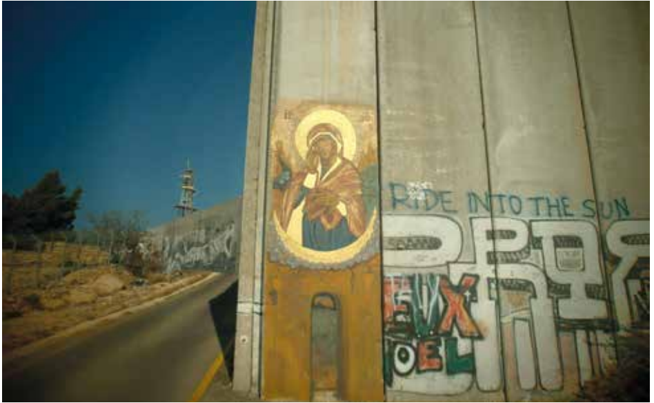
Wandmalereien und Botschaften zieren den Sperrwall an vielen Orten. Diese Ikone befindet sich in der Nähe von Bethlehem, nahe des Checkpoints 300.

Abraham-Moschee und der unmittelbar daran angrenzenden Machpela-Synagoge - innerhalb eines gemeinsamen, aber strikt getrennt zugänglichen Gebäudekomplexes.